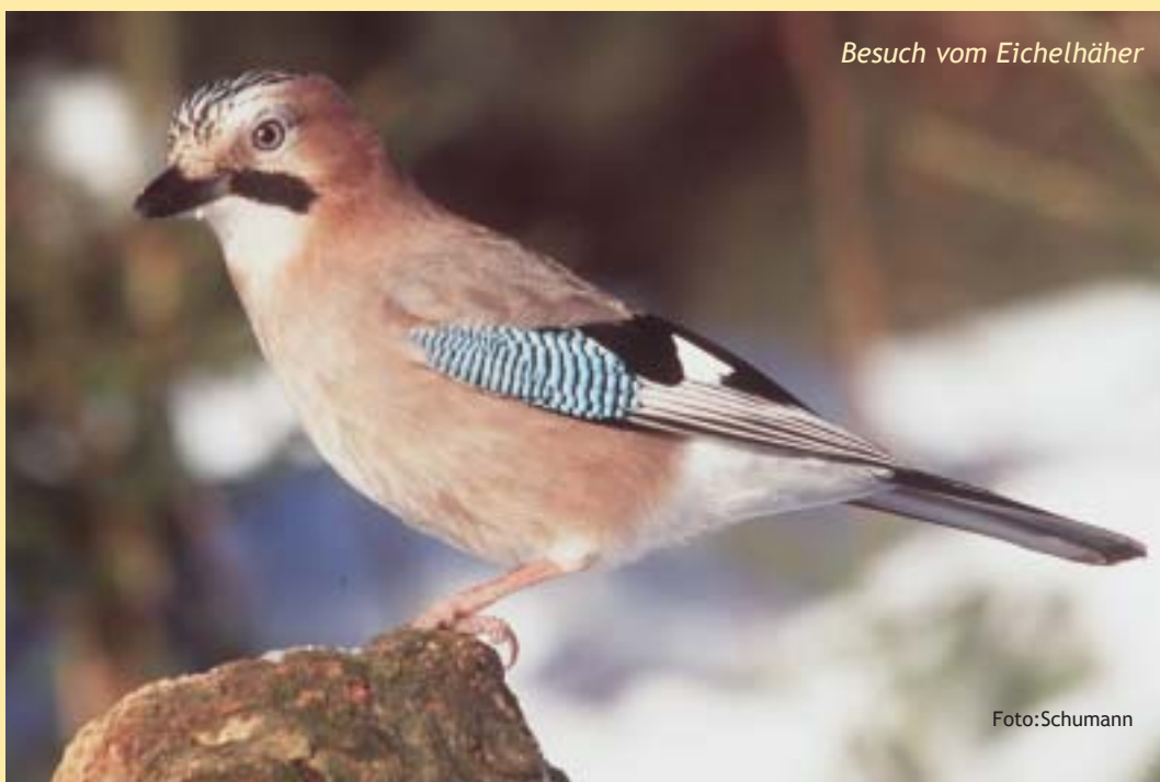
Besuch vom Eichelhäher

Aber auch gefüllte Nuss-Säckchen, gefüllte Tontöpfe und Kokoschalen werden gerne angenommen und bieten je nach Füllung unseren Vögeln (Weichfressern und Insektenfressern) eine artgerechte und gesunde Nahrung.