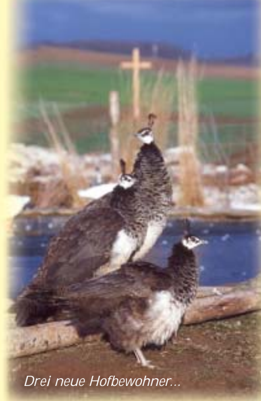
Drei neue Hofbewohner...

Liebe Freunde und Förderer, ein erfülltes Jahr geht zu Ende und viele neue Aufgaben sind für das kommende Jahr geplant. Wir möchten an dieser Stelle nicht versäumen, allen die uns im vergangenen Jahr unterstützt haben, ganz herzlich zu danken.