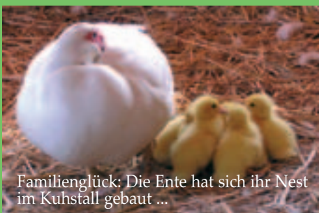
Familienglück: Die Ente hat sich ihr Nest im Kuhstall gebaut ...