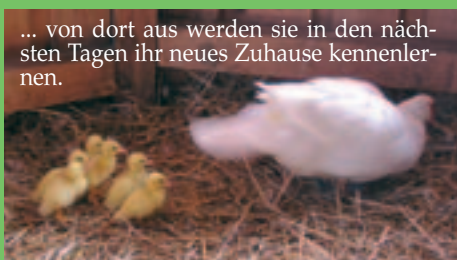
... von dort aus werden sie in den nächsten Tagen ihr neues Zuhause kennenlernen.