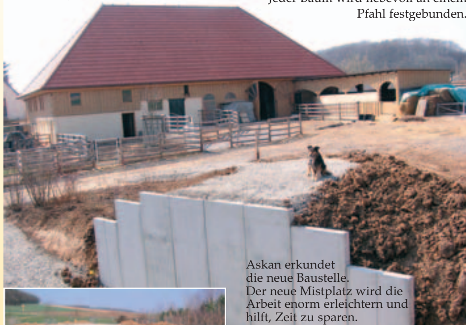
Askan erkundet die neue Baustelle. Der neue Mistplatz wird die Arbeit enorm erleichtern und hilft, Zeit zu sparen.