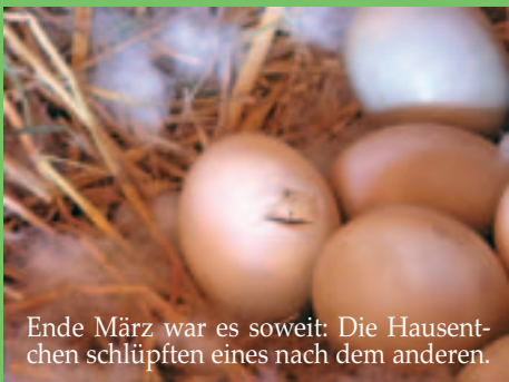
Ende März war es soweit: Die Hausentchen schlüpften eines nach dem anderen.

Wir haben im Kleinen begonnen, Tieren eine Heimat zu geben, in der sie ihre geistige Stellung und ihren geistigen Wert wiederfinden. Tiere sind unsere Übernächsten. Sie sind unsere Naturgeschwister, denn uns verbindet ein Geist. Es ist der große Geist des Alls - der Unendlichkeit, der Liebe und Einheit ist.