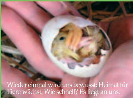
Wieder einmal wird uns bewusst: Heimat für Tiere wächst. Wie schnell? Es liegt an uns.