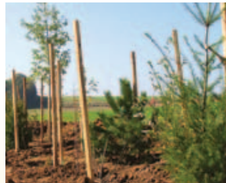
Jeder Baum wird liebevoll an einem Pfahl festgebunden.

Frühlingszeit ist Pflanzzeit. Und Pflanzen bedeuten Lebensraum für Tiere. So haben wir uns entschlossen, die nächsten Wochen dafür zu nutzen, den Hof und die Außenanlagen weiter zu bepflanzen. Besonders gilt dies hinter dem Stallgebäude, wo wir für den praktischeren Mist-Abtransport in Containern einen Containerplatz im Erdreich geschaffen haben. Dieses neu angelegte Gelände wollen wir mit verschiedenen Sträuchern und Boden-deckern begrünen.