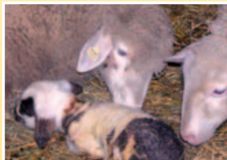
Die ganze Schafherde hat bei der Geburt mitgeföhlt und den Neuankömmling empfangen.

gestanden, zwar noch etwas wackelig, aber mit starkem Lebenswillen. Die ersten Male halfen wir dem neuen Erdenbewohner, den wir Bernhard »taufte«, noch beim Trinken. Er hatte etwas Schwierigkeiten, das Euter zu finden, doch längst trinkt er selbständig.