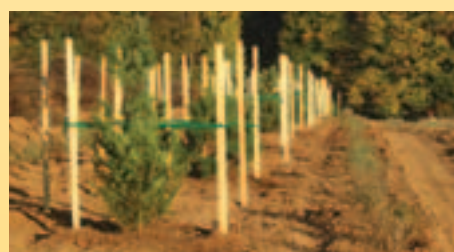
Die Bäume und Sträucher in den Hecken vom letzten Jahr sind gut angewachsen.

Außerdem wollen wir auf den neu erworbenen Weiden viele, viele Bäume als Schattenspender für die Tiere pflanzen. Auch sind kleine Bauminseln auf den Weiden und weitere Hecken entlang den Weiden geplant.